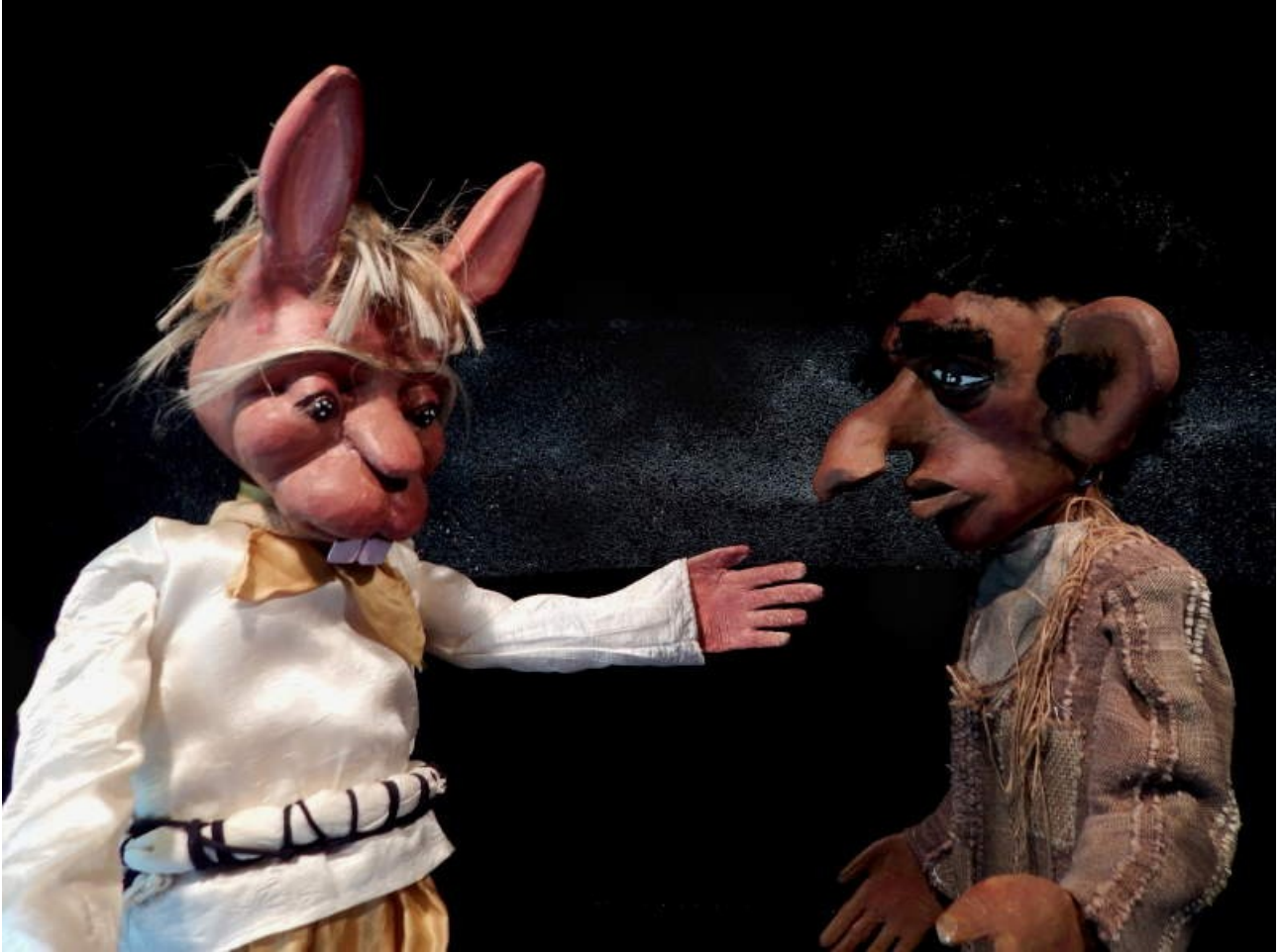
Konpè Lapen avè Konpè Zanba