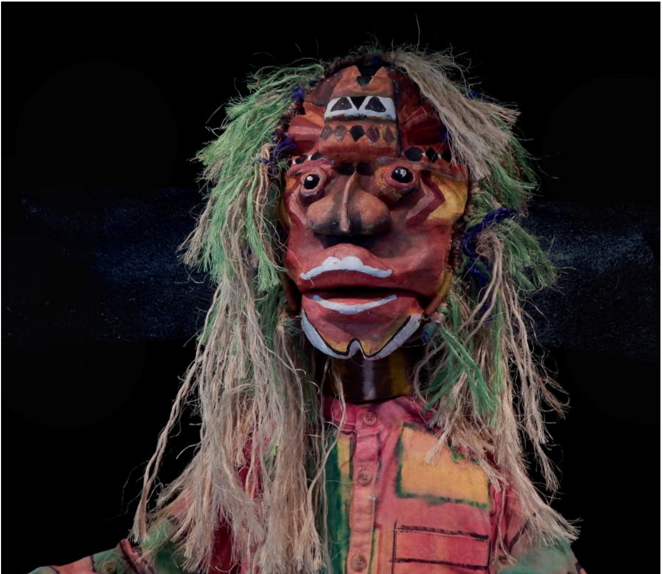
Met a kont