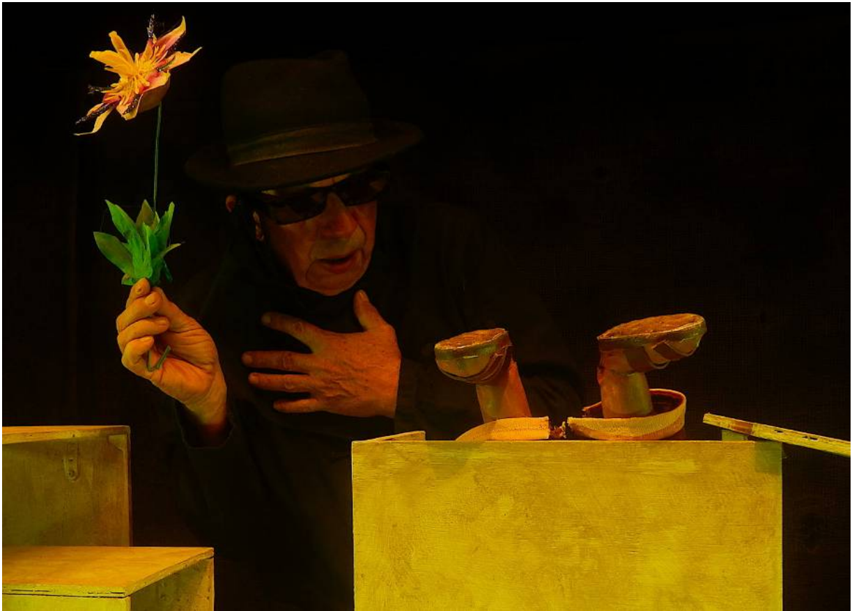
Diab la ka wonflé kon on vié kochon ka méné on mobilèt Gréna