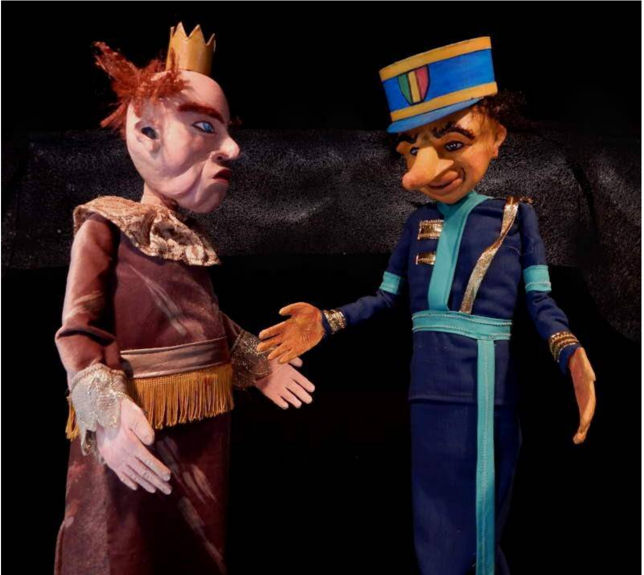
Misié Liwoi avè Lalwa